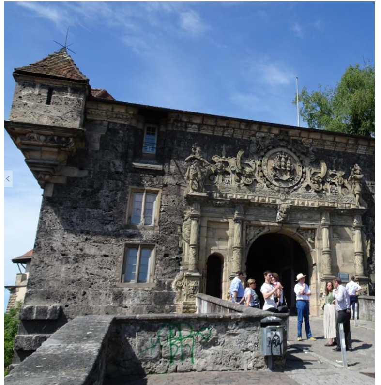
Unterwegs auf der Stadtführung in Tübingen, vor dem Schloss Hohentübingen