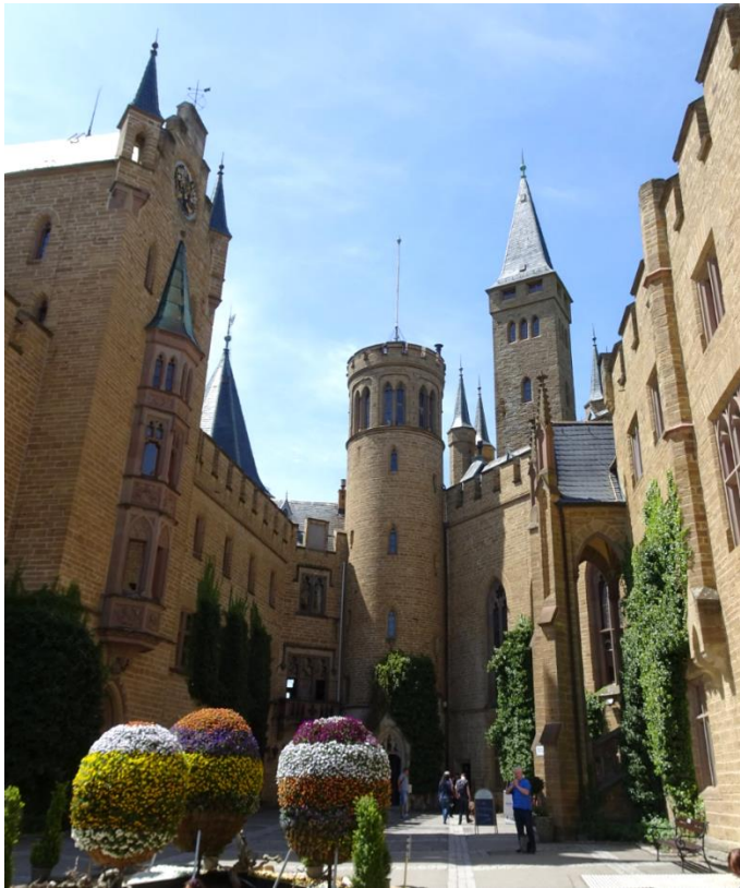
Innenhof der Burg Hohenzollern aus dem 19. Jahrhundert