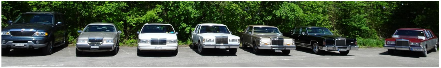
Die LCCE- Fahrzeugparade bei der Burg Hohenzollern am Samstag, 21. Mai