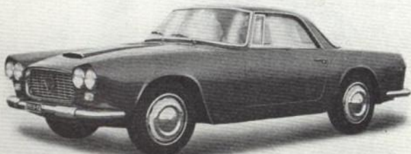
Lancia Flaminia Gran Turismo (Touring)

Transmission: Rapport du pont 3,82:1 (11/42).