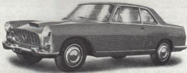
Lancia Flaminia Coupé

Karosserie, Masse, Gewicht: Radstand 287 cm, Spur vorn 136,7 cm, hinten 137 cm, Bodenfreiheit 14 cm, Wendekreis 12 m. Sedan, 4türig, 5/6plätzig, Länge 485,5 cm, Breite 175 cm, Höhe 146 cm, Gewicht trocken 1480 kg, zulässiges Gesamtgewicht 1880 kg.