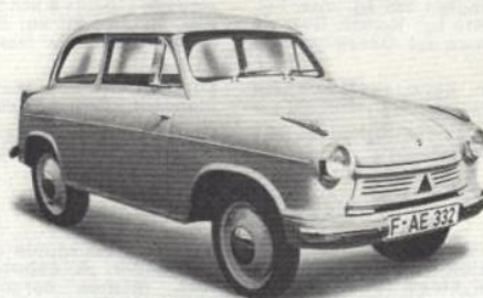
Lloyd Alexander 600

Performances: Vitesse max. env. 180 km/h 1) , rapport poids/puissance variant entre 7,3 et 8,1 kg/ch (SAE), vitesse à 1000 tr/mn sur le rapport sup.: Twin-Range Turbo Drive (2,89:1) 46,2 km/h, consomm. d'essence 18-25 L/100 km 1) . 1) Donnée approx. de la rédaction.