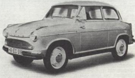
Lloyd Alexander TS

Moteur (dimensions): 3,04 CV-impôt, 2 cyl. en ligne, alésage 77 mm, course 64 mm, 596 cm 3 , compr. 6,6:1, 19 ch (DIN) à 4500 tr/mn, 24 ch (SAE) à 4500 tr/mn, couple max. 3,9 mkg (DIN) à 2500 tr/mn, puissance spécif. 31,9 ch/L (DIN), 40,2 ch/L (SAE).